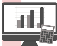
Service de comptabilité