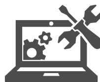
Entretien et réparation