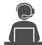
Support technique à distance