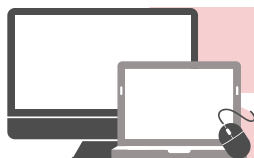
Vente au détail de matériel informatique