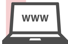
Conception et maintenance de site internet