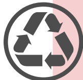
Recyclage de matériel